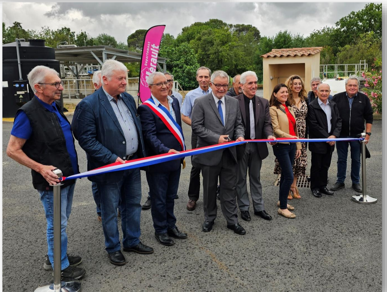
Inauguration de la station d'épuration de Magalas (boues activées)