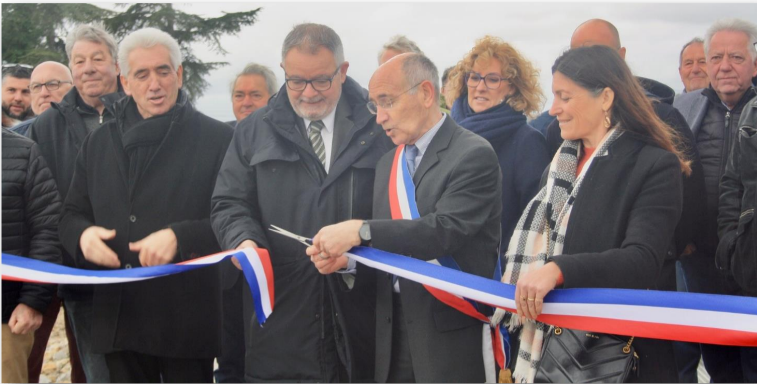
Inauguration de la station d'épuration de Autignac (filtres plantés de roseaux)